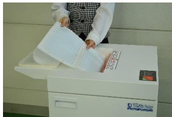
400mmのワイド投入口で連続帳票の細断にも対応。