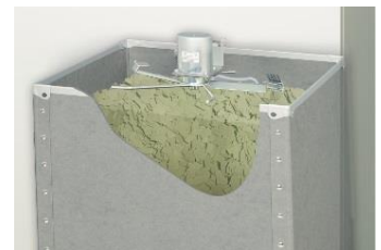
くず箱中央に盛り上がる紙片を自動でならして収容率アップ。